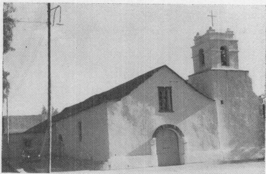
Iglesia Parroquial de San Pedro de Atacama, centro de las actividades.