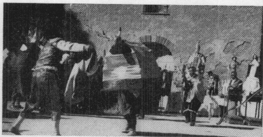
"Danza del Toro" frente al Santo, del grupo de Séquitor.