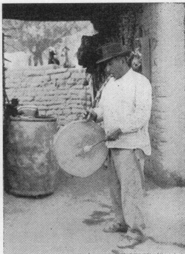
El "Niño Mayor", ejecutante único de flauta y tambor durante las danzas.