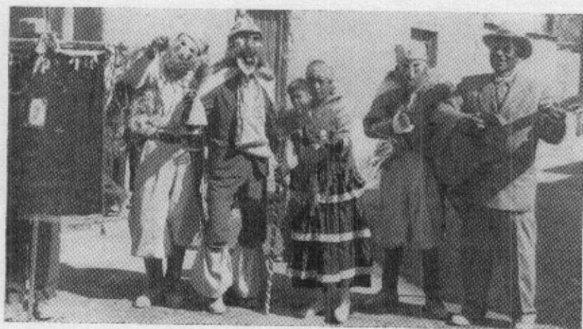
Grupo llamado "del Negro", procedente de Séquitor.