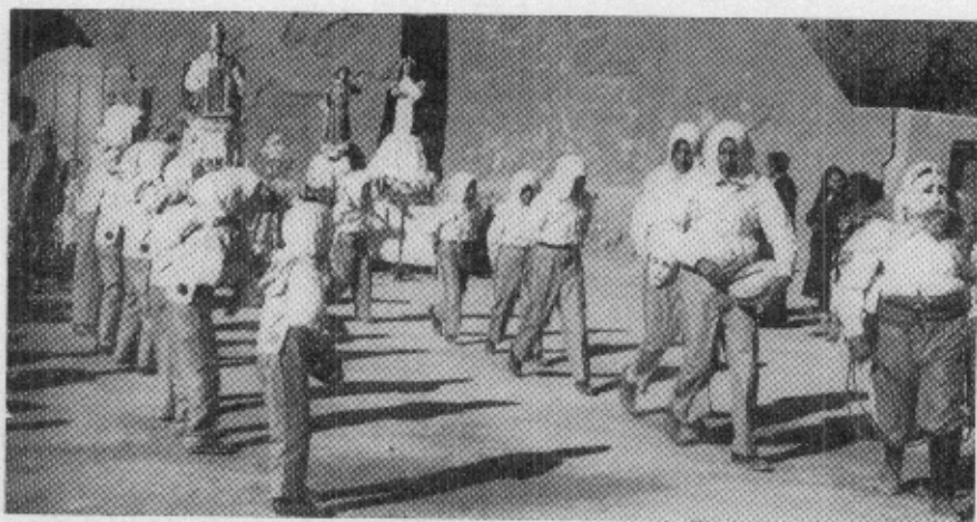
Grupo de los "Catimbanos" antes de iniciar su danza.