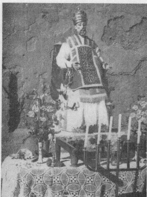
Imágen de San Pedro, Patrono de la Villa. Anda colocada fuera de la Iglesia, frente a la cual se efectúan las danzas rituales.